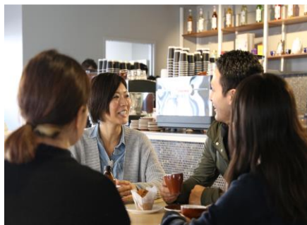
Green bean cafe